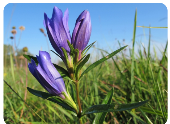
Gentiana pneumonanthe L.