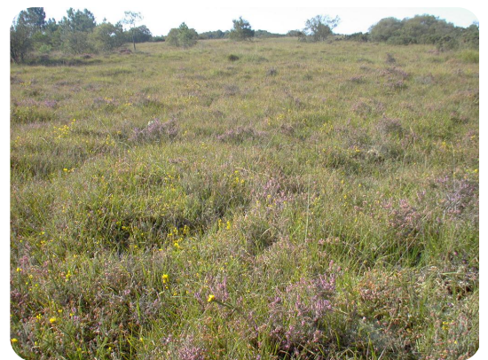
La Lande du Camp (Lessay, 50)