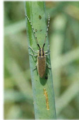
Agapanthia asphodeli (LATREILLE, 1804) sur Asphodelus sp.

En souhaitant que ces documents vous aident dans vos recherches.