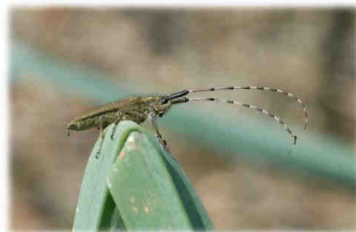
Agapanthia asphodeli (LATREILLE, 1804) sur Asphodelus sp.

Agapanthia asphodeli (LATREILLE, 1804), Cerambycidae de la sous-famille des Lamiinae, est spécifiquement inféodé aux Liliacées du genre Asphodelus . Les Asphodèles fleurissent de fin avril à juin sur les talus, en bordure de chemin, mais aussi en sous-bois et landes. Agapanthia asphodeli , dont la larve se développe dans les tiges des Asphodèles, s'observe à l'état adulte au collet des plantes en matinée, puis, avec l'augmentation de la température en journée, sur les feuilles, les tiges et les hampes florales. Un indice de présence d' A. asphodeli est le grignotage visible de la tige ou des feuilles de l'Asphodèle, comme l'a observé Serge RISSER (cf. photographie). Nous avons recensé à ce jour 94 témoignages de présence d' A. asphodeli dans les départements 35, 44, 49, 56, 79 et 85 entre le 22 avril et le 26 juin ; les observations se rapportant aux deux espèces de Liliacées Asphodelus albus Miller et Asphodelus macrocarpus var. arrondeaui loyd.